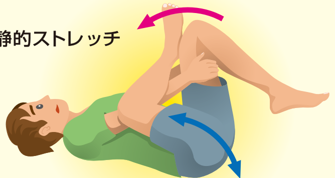
ふくらはぎ・ 太もも裏の静的ストレッチ

ストレッチする側の足首を逆側の膝の前に 引っ掛けて交差する。 そこから逆側の膝の裏から両手で抱えて、 ヘソの方へ引き寄せる。