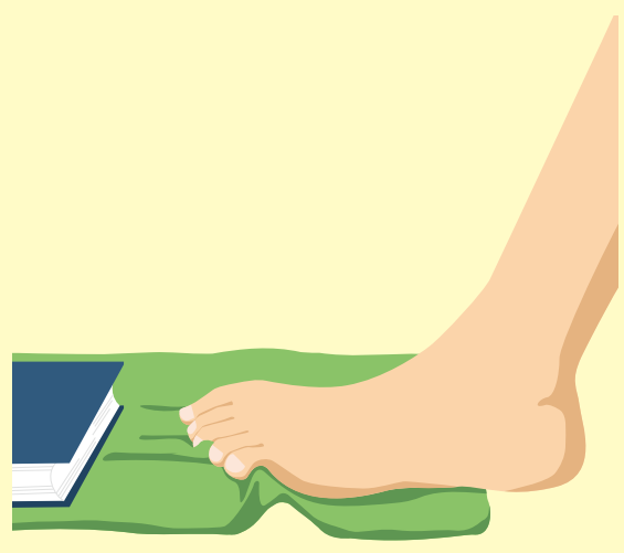
タオルギャザー(足底の筋肉の強化)