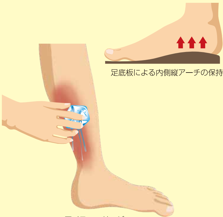
足底板による内側縦アーチの保持

痛みが強い場合は慢性化を避けるために運動量を減らす必要があり、アイスマッサージや外用薬の使用、足底や足関節周囲の筋肉の強化やストレッチを行います。足底板も効果的で、クッション性が良くかかとの安定したシューズを選ぶことも重要です。