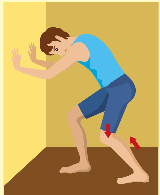
ヒラメ筋のストレッチ(膝を曲げる)