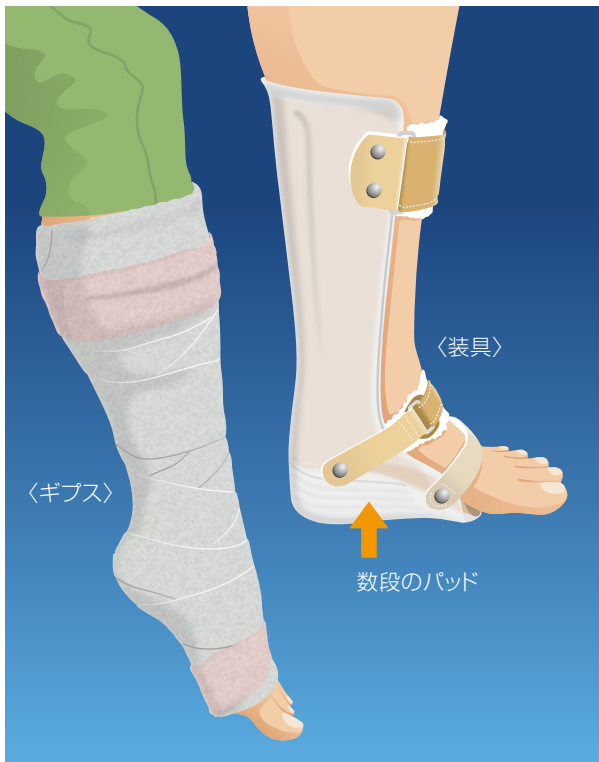
ギプスや装具による保存療法

手術療法は、しっかりと腱を縫合するため、ギプス固定期間が短縮され、早期の社会復帰が可能となります。職場への復帰は、手術療法を行った方が早いと言われています。低侵襲手術を行えば、手術後感染症の発生率を低くすることができます。